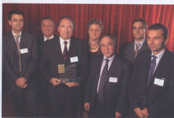
L'équipe du cabinet Racine, Lauréat du Trophée «Firme entrepreneuriale»