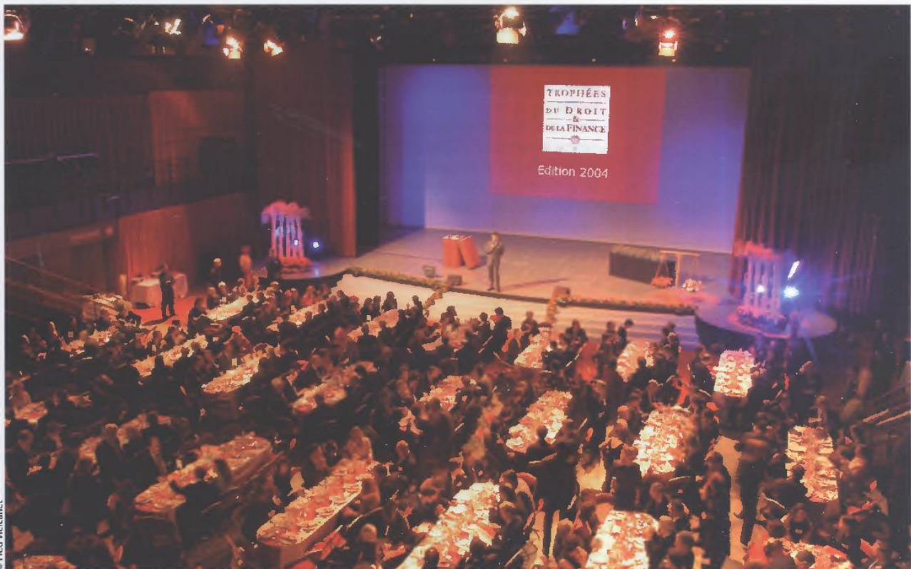
Le dîner de gala au théâtre de l'Empire

Les médias nationaux et internationaux ont cette année particulièrement marqué leur intérêt pour cette soirée atypique puisque la cérémonie était suivie par la radio BFM , Le Figaro Entreprises , Le Revenu , Legal Week , The Wall Street Journal Europe , Global Counsel ou encore le site Internet Fusacq .